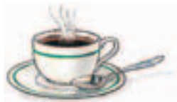
4. un café