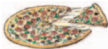
5. una pizza