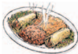
2. una enchilada