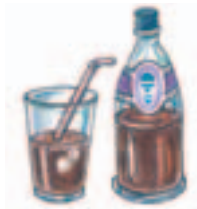
2. una cola