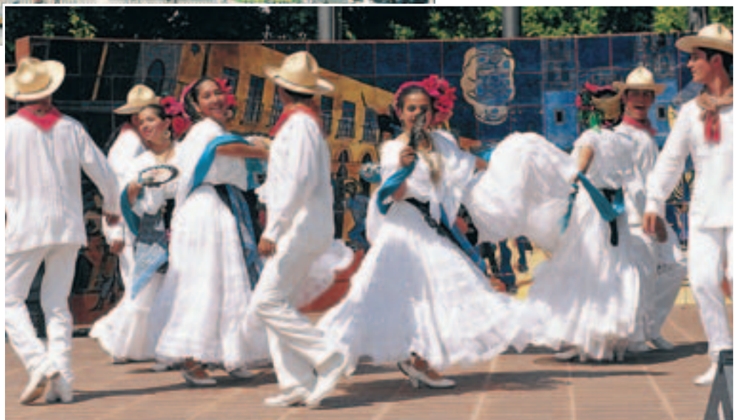
Celebración del Cinco de Mayo