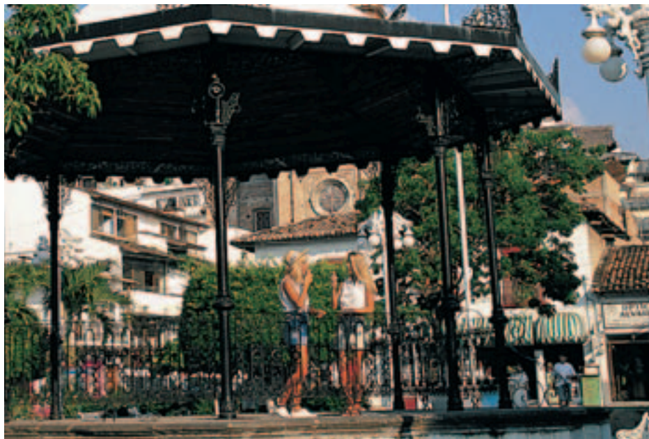
Puerto Vallarta, México