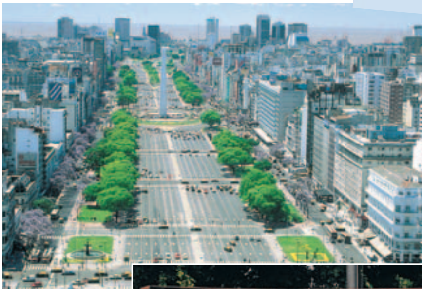
Avenida 9 de Julio, Buenos Aires, Argentina