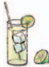
3. una limonada