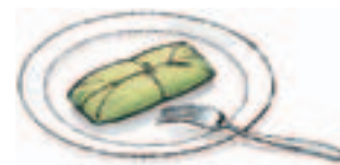
3. un tamal