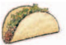
1. un taco